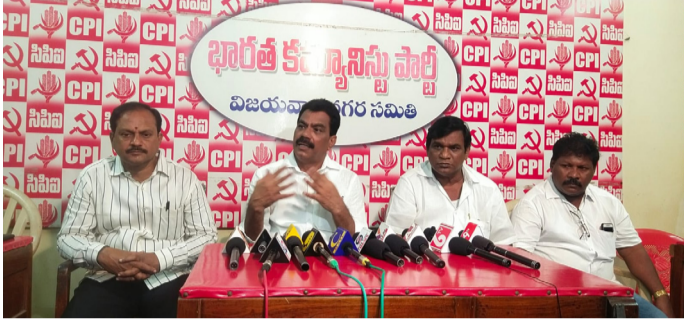
ఈరోజు ప్రతినిధి: విజయవాడ : అడుగడుగునా అధికార వాహనమిత్ర పేరుతో ప్రభుత్వం విజయవాడ వచ్చి మ నియోజకవర్గంలో నిర్వహించిన కార్యక్రమం సందర్భంగా