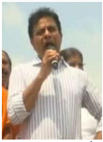
ఖమ్మం సెప్టెంబర్ 30 ఈరోజు ప్రతినిధి: తెలంగాణ రాష్ట్రంలో గత

దేశవ్యాప్తంగా ప్రాంతీయ పార్టీలకే ప్రజల ఆసక్తి చెబుతున్నారు అంటున్న సర్వేలు.