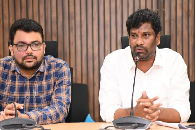
జీవో 342 ప్రకారం దళితులకు 101 యూనిట్ల విద్యుత్ ఉచితంగా ఇవ్వాలి

ప్రారంభిస్తున్న, 25 కోట్ల రూపాయలతో ప్రత్యేక నిధులతో పలు అభివృద్ధి పనులకు భూమి మున్సిపల్ శాఖ నుండి మంజూరైన 20 కోట్ల రూపాయలతో మున్సిపాలిటీలో పలు అభివృద్ధి పనులకు భూమి పూజ. రామకృష్ణపూర్ - మందమర్రి పట్టణాల మధ్యలో కాళీ నగర్ వద్ద 8 కోట్ల రూపాయలతో పాలవారుపై నిర్మించే వంతెనకు భూమి పూజ. 3.30 కోట్ల రూపాయలతో మందమర్రి పట్టణంలో నూతనంగా నిర్మించిన సెంట్రల్ లైటింగ్ ప్రారంభిస్తున్నాం. 2 కోట్ల రూపాయలతో మందమర్రి పట్టణంలో నిర్మించిన నమ్మక్క - సారలమ్మ మహిళా భవన్ ప్రారంభిస్తున్నాం. 1 కోటి రూపాయలతో నిర్మించిన “కేసిఆర్ మల్టీపర్పస్ కమ్యూనిటీ భవనం” ప్రారంభిస్తున్నాం. 1.54 కోట్ల రూపాయలతో నిర్మించే 2 చెక్ డ్యామ్ను కు శంకుస్థాపన. 5 లక్షల రూపాయలతో నిర్మించిన బతుకమ్మ బహిరంగ నభల్లో మంత్రి మైదానం ప్రారంభిస్తున్నాం. 22.90 కోట్ల రూపాయలతో మందమర్రి పట్టణంలో తుది దశకు చేరుకున్న రైల్వే ఓవర్ బ్రిడ్జి వసూలు పరిశీలన, అనంతరం మందమర్రి పట్టణంలో నిర్వహించనున్న రోడ్ షోలో పాల్గొంటారని ఆయన తెలిపారు. అదేవిధంగా క్యాతనపల్లి మున్సిపాలిటీలో 25 కోట్ల ప్రత్యేక నిధులు, 15 కోట్ల డి.ఎం.ఎఫ్.టి. నిధులు మొత్తంగా 40 కోట్ల రూపాయలతో పలు అభివృద్ధి పనులకు భూమి పూజ, 15.16 కోట్ల రూపాయలతో రామకృష్ణపూర్ పట్టణంలో నిర్మించిన 286 డబుల్ బెడ్ రూమ్ ఇండ్ల ప్రారంభిస్తున్నాం, 50 కోట్ల రూపాయలతో గాంధారి వసం వద్ద 250 ఎకరాల్లో నిర్మించే కె.సి.ఆర్. అర్బన్ పార్క్ రూపాయలతో నిర్మించిన “కేసిఆర్ మల్టీపర్పస్ కమ్యూనిటీ భవనం” ప్రారంభిస్తున్నాం. 1.54 కోట్ల రూపాయలతో నిర్మించే 2 చెక్ డ్యామ్ను కు శంకుస్థాపన. 5 లక్షల రూపాయలతో నిర్మించిన బతుకమ్మ బహిరంగ నభల్లో మంత్రి మైదానం ప్రారంభిస్తున్నాం.